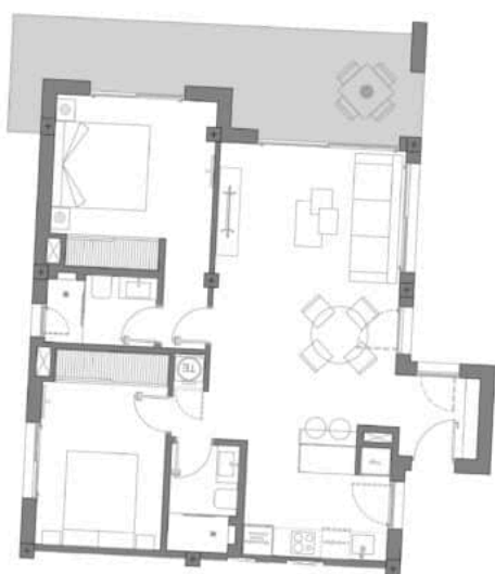
Bloque 3 MODELO ICONIC 2D Nº 20A PL1ª