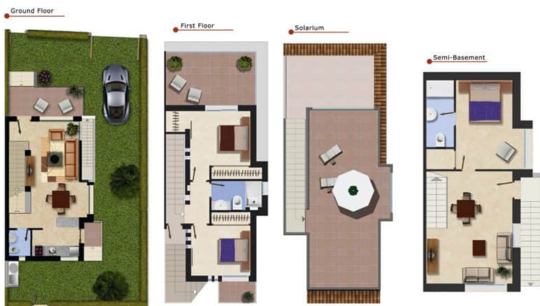
Imagen Artística carece de valor contractual/Artistic Image free of contractual nature

Model: Samara Corner Property: 150,7m 2 Garden: 82-100m 2 Roof-Terrace: 30m 2 Semi-Basement: 54,1m 2 3 Bedrooms 3 Bathrooms