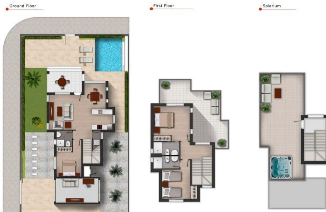
Imagen Artística carece de valor contractual/Artistic Image free of contractual nature

Model: Villa Jade Plot: 268,5m 2 Property: 194,31m 2 Terrace: 40m 2 Solarium: 30m 2