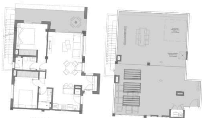
Bloque 3 MODELO ICONIC 2D Nº 22A PL. ÁTICO