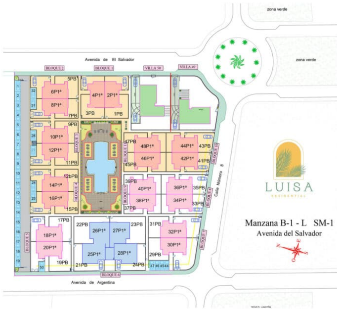
LUISA RESIDENTIAL - GENERAL PLAN

Property information may be subject to errors and is not contractual. The surfaces expressed are approximate, being able to undergo modifications for technical reasons. Artistic Images Free Of Contractual Nature.