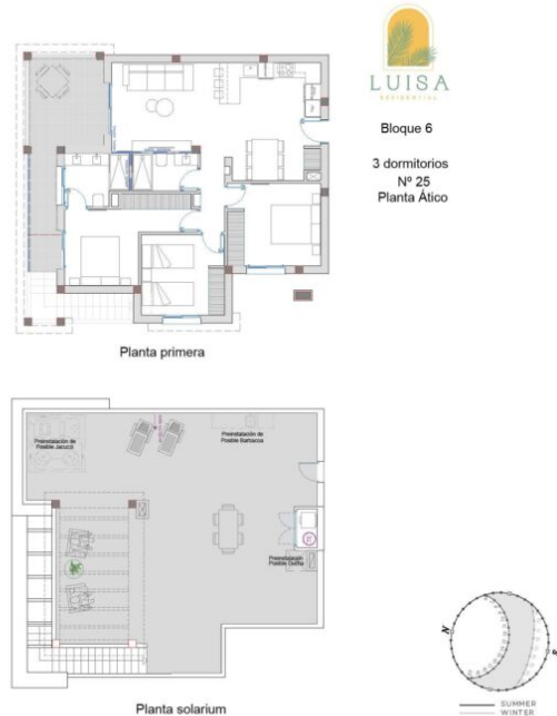
LUISA RESIDENTIAL - 25 JAZMÍN PENTHOUSE

Property information may be subject to errors and is not contractual. The surfaces expressed are approximate, being able to undergo modifications for technical reasons. Artistic Images Free Of Contractual Nature.