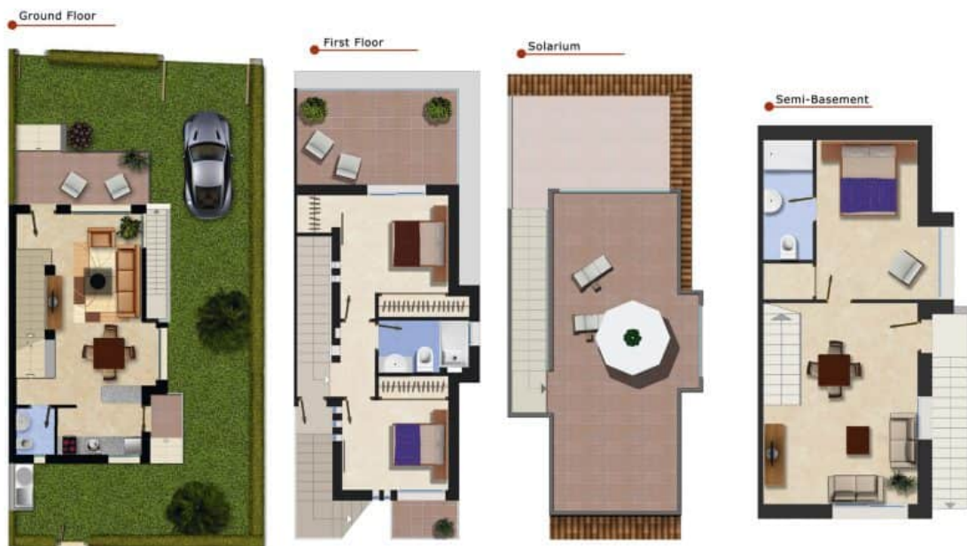
Imagen Artística carece de valor contractual/Artistic Image free of contractual nature

Model: Samara Corner Property: 150,7m 2 Garden: 82-100m 2 Roof-Terrace: 30m 2 Semi-Basement: 54,1m 2 3 Bedrooms 3 Bathrooms