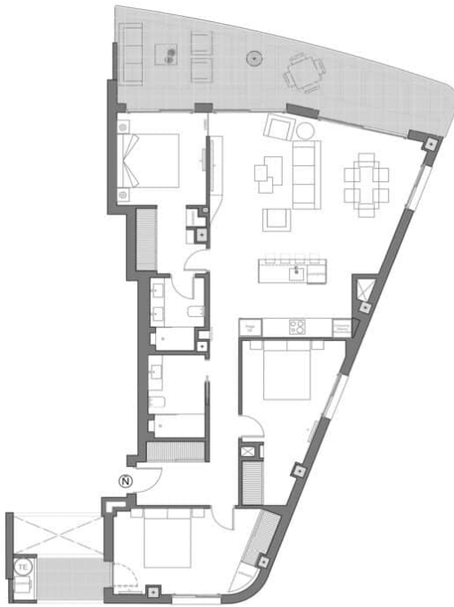
PENTHOUSE BLOCK B - MODEL TYPE Ñ

3 BEDROOMS, 2 BATHROOMS TOTAL SURFACE: 158.64 M 2 PROPERTY SURFACE: 128.69 M 2 TERRACE: 29.95 M 2 SOLARIUM: 9.6 M 2 STORAGE ROOM: 5.5 M 2