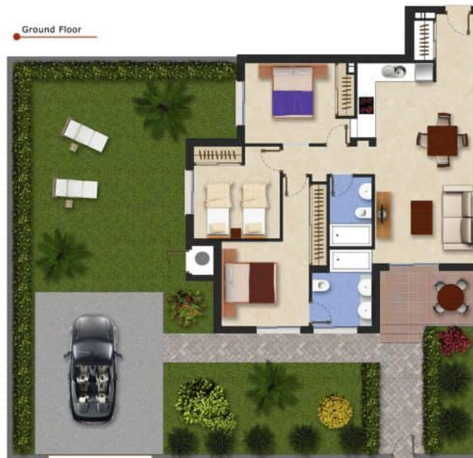
Imagen Artística carece de valor contractual/Artistic Image free of contractual nature

Model: Alba Garden Property: 96,3m 2 Garden: 125-180m 2 3 Bedrooms 2 Bathrooms