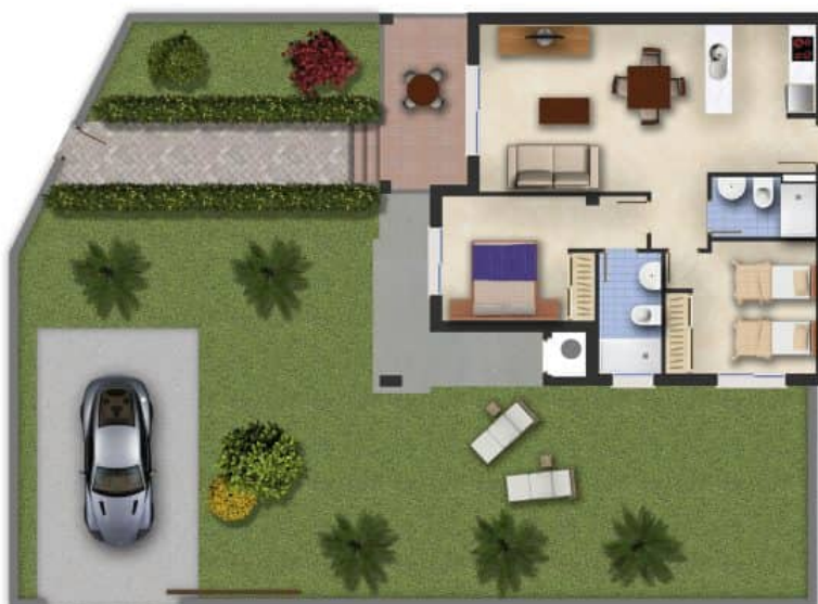
Imagen Artística carece de valor contractual/Artistic Image free of contractual nature

Model: Alba Garden Property: 76,7m 2 Garden: 65-146m 2 2 Bedrooms 2 Bathrooms