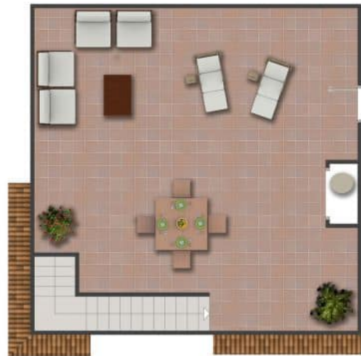
Imagen Artística carece de valor contractual/Artistic Image free of contractual nature