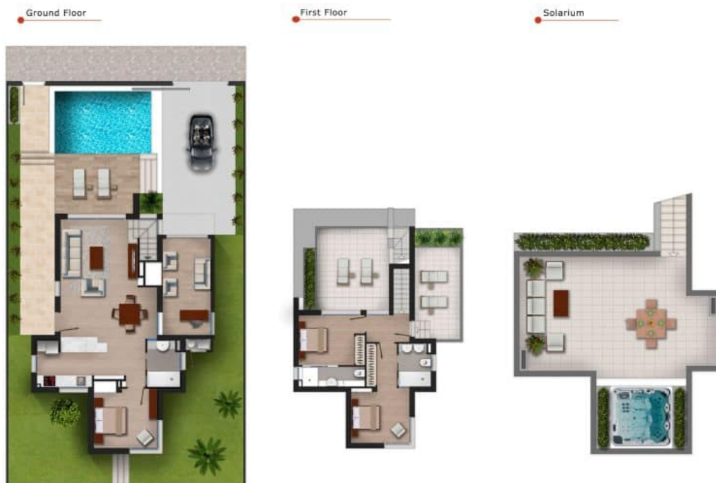
Imagen Artística carece de valor contractual/Artistic Image free of contractual nature

Model: Villa Agata Plot: 263 - 283,2m 2 Property: 167,3m 2 Terraces: 2 Solarium: 40m 2