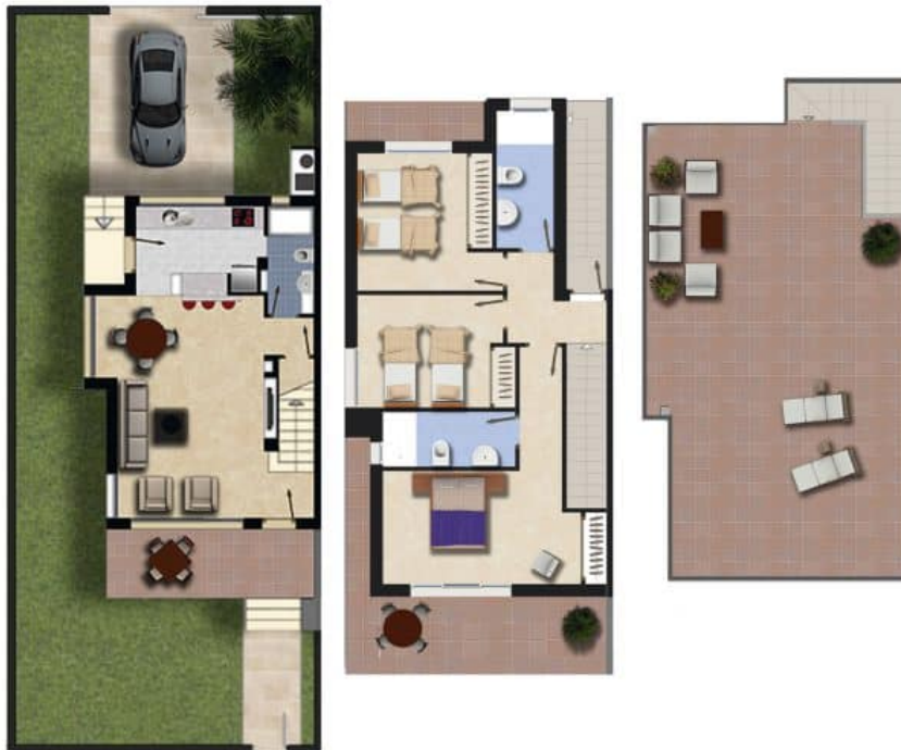
Imagen Artística carece de valor contractual/Artistic Image free of contractual nature

Model: Ivory 3 Dorm Property: 127,5m 2 Garden: 110-168m 2 Solarium: 55m 2 3 Bedrooms 3 Bathrooms