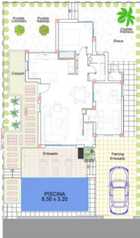
C/ Isla de Vedranell