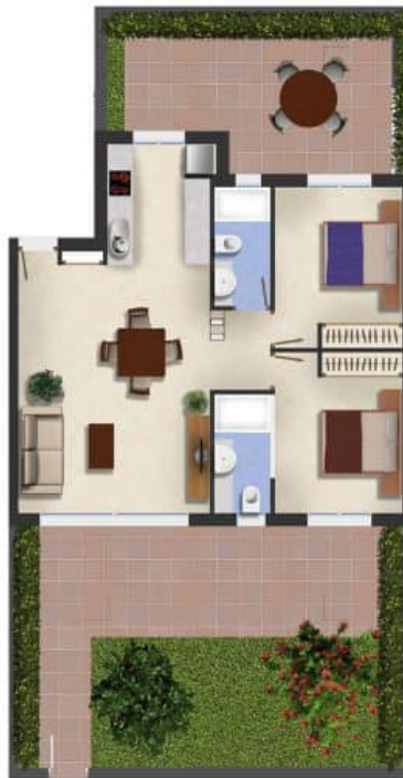
Imagen Artística carece de valor contractual/Artistic Image free of contractual nature