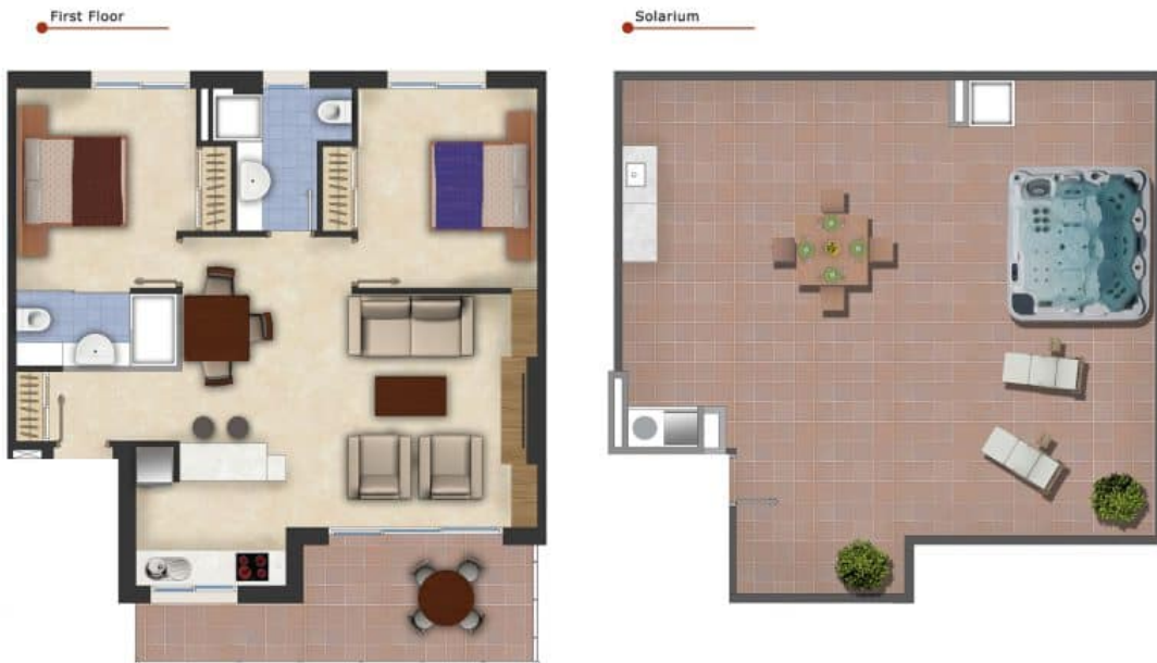
Imagen Artística carece de valor contractual/Artistic Image free of contractual nature

Model: Penthouse Property: 79,68-86,04m 2 Solarium: 66-73m 2 2 Bedrooms - 2 Bathrooms