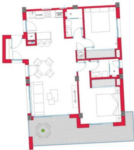
Bloque 2 MODELO ICONIC 2D Nº 11A PL 1ª