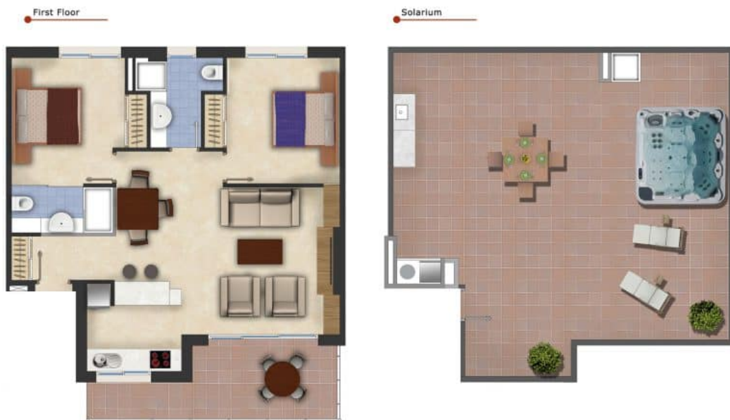
Imagen Artística carece de valor contractual/Artistic Image free of contractual nature

Model: Penthouse Property: 79,68-86,04m 2 Solarium: 66-73m 2 2 Bedrooms - 2 Bathrooms