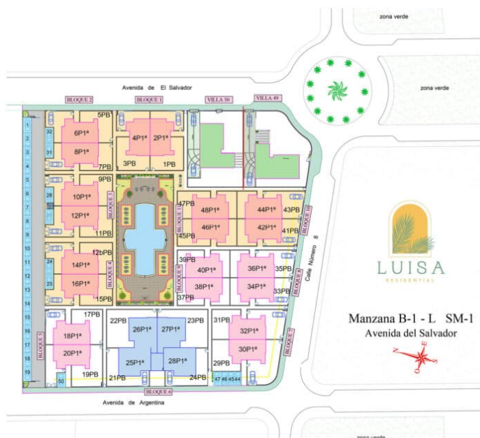
LUISA RESIDENTIAL - GENERAL PLAN