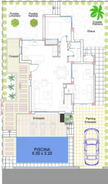
C/ Isla de Vedranell