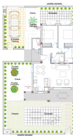
LUISA RESIDENTIAL - 3 LUISA GARDEN

LUISA Bloque 1 Modelo LUISA GARDEN 2 dormitorios Nº 3 Planta Baja