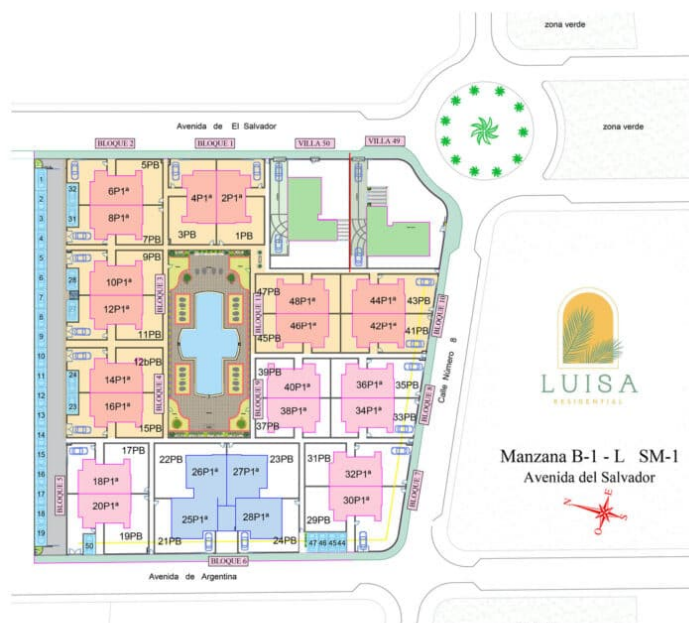
LUISA RESIDENTIAL - GENERAL PLAN

Property information may be subject to errors and is not contractual. The surfaces expressed are approximate, being able to undergo modifications for technical reasons. Artistic Images Free Of Contractual Nature.