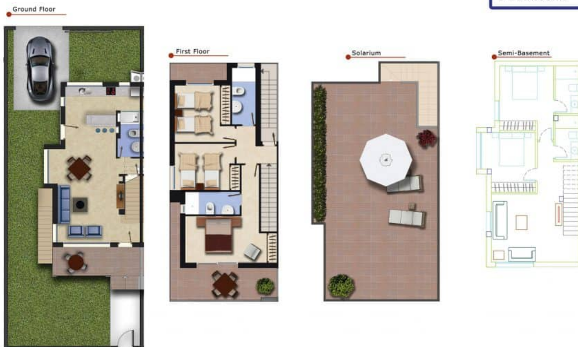
Imagen Artística carece de valor contractual/Artistic Image free of contractual nature

Model: Ivory Corner Property: 203,9m 2 Garden: 115m 2 Roof-Terrace: 50m 2 Semi-Basement: 71,7m 2 5 Bedrooms 5 Bathrooms