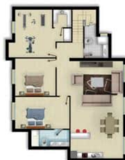
Imagen artística carece de valor contractual - Artistic image free of contractual nature