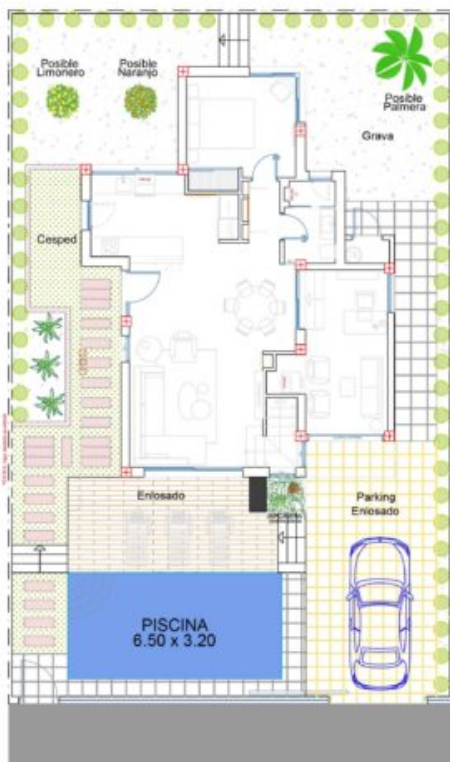
C/ Isla de Vedranell