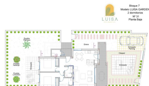
LUISA RESIDENTIAL - 31 LUISA GARDEN

Los exteriores incluyen embaldosado, grava y césped según plano * Plantas y riego no incluidos The exteriors include paving, gravel and grass according to house plans * Plants and irrigation are not included