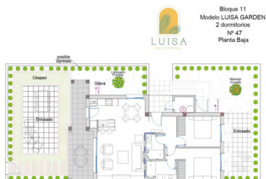
LUISA RESIDENTIAL - 47 LUISA GARDEN

Los exteriores incluyen enlosado, grava y césped según plano * Plantas y riego no incluidos The exteriors include paving, gravel and grass according to house plans * Plants and irrigation are not included