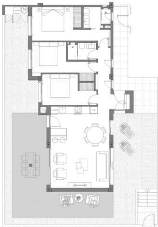
Bloque 1 MODELO ICONIC 3D Nº 1B GARDEN