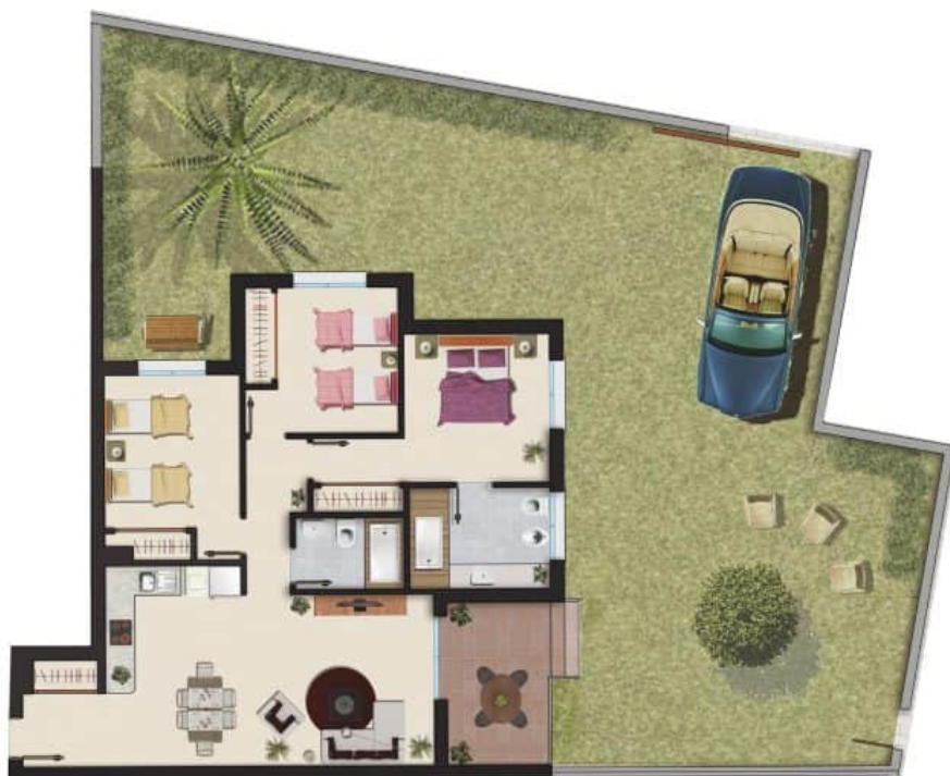
Imagen Artística carece de valor contractual/Artistic Image free of contractual nature

Model: Planta Garden 3 Bedrooms Property: 102,4m 2 Garden: 35/95m 2