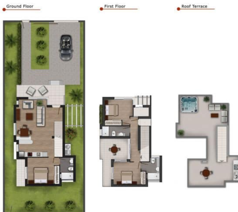
Imagen Artística carece de valor contractual/Artistic Image free of contractual nature

Model: Maria Corner Property: 118m 2 Garden: 138m 2 Roof-Terrace: 40m 2 3 Bedrooms 3 Bathrooms