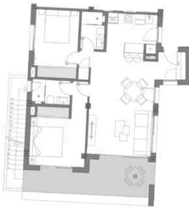
Bloque 3 MODELO ICONIC 2D Nº 21A PL. ÁTICO